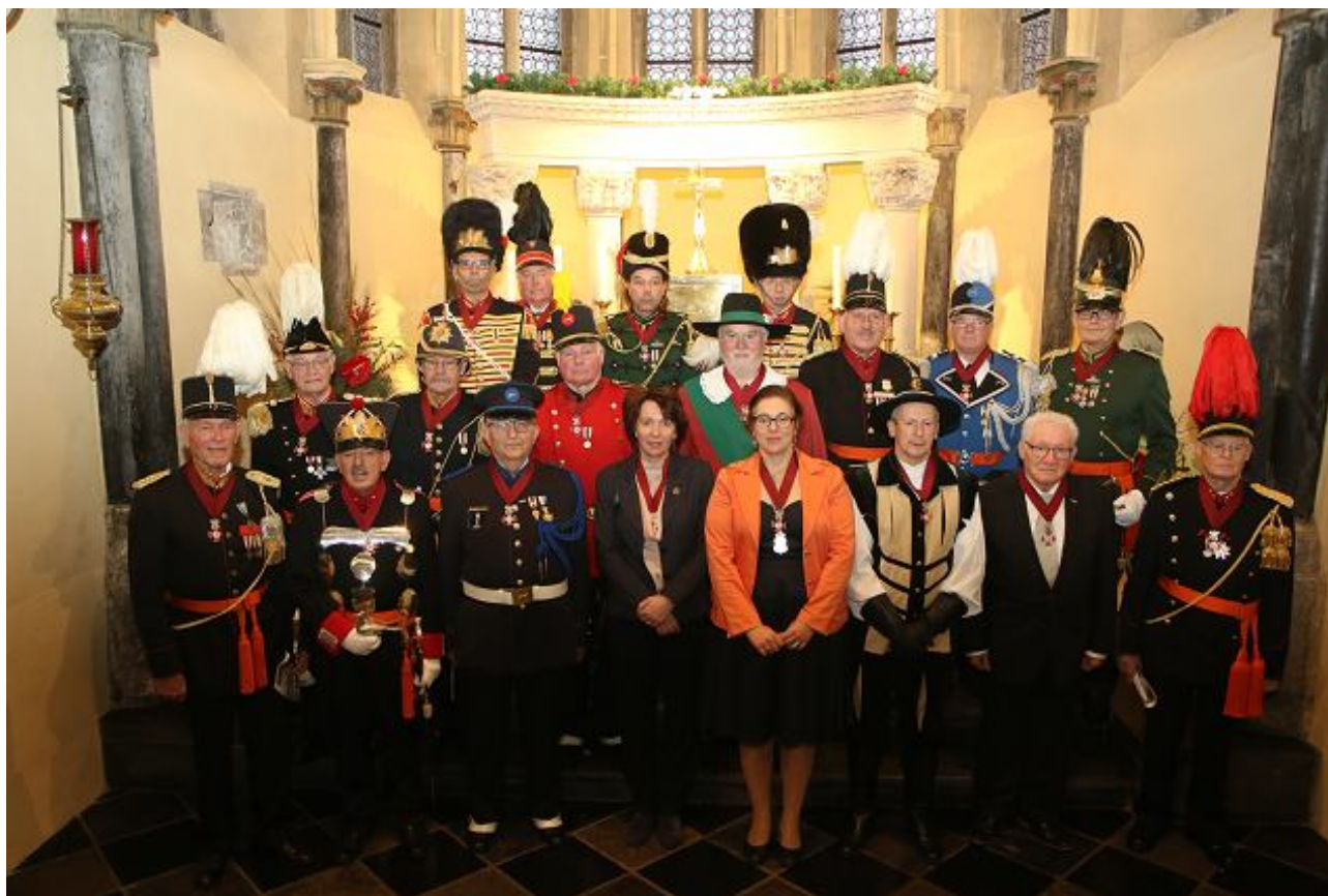
De gedecoreerden van de Rode Leeuw 2020

Zondag 26 januari 2020 vond in Wessem de investituur plaats van de Orde van de Rode Leeuw van Limburg en de Heilige Sebastianus. Iedereen werd keurig ontvangen in het café-zaal de Harmonie in Wessem met een kop koffie/thee en vlaai, waarna iedereen, door de schutterij Sint Joris Wessem werd begeleidt naar de Sint Medardus Kerk, waar de plechtige Eucharistieviering plaatsvond. Mede door de prachtige opulstering vanuit het muziekkorps van de schutterij werd het een indrukwekkende viering. In een gezellig samenzijn in de zaal 'De Harmonie' werd er nog na geborred.