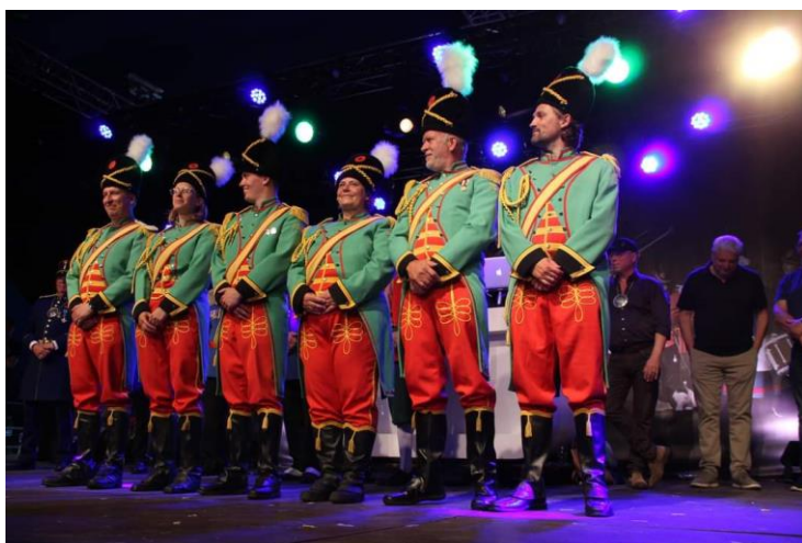
Sint Martinus Niel bij As: Eervol tweede