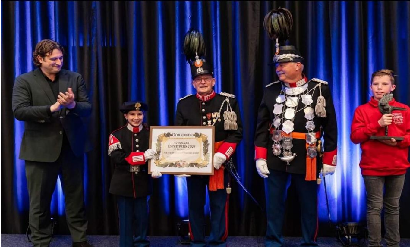
De schutterij Sint Sebastians Klimmen won de Espritprijs