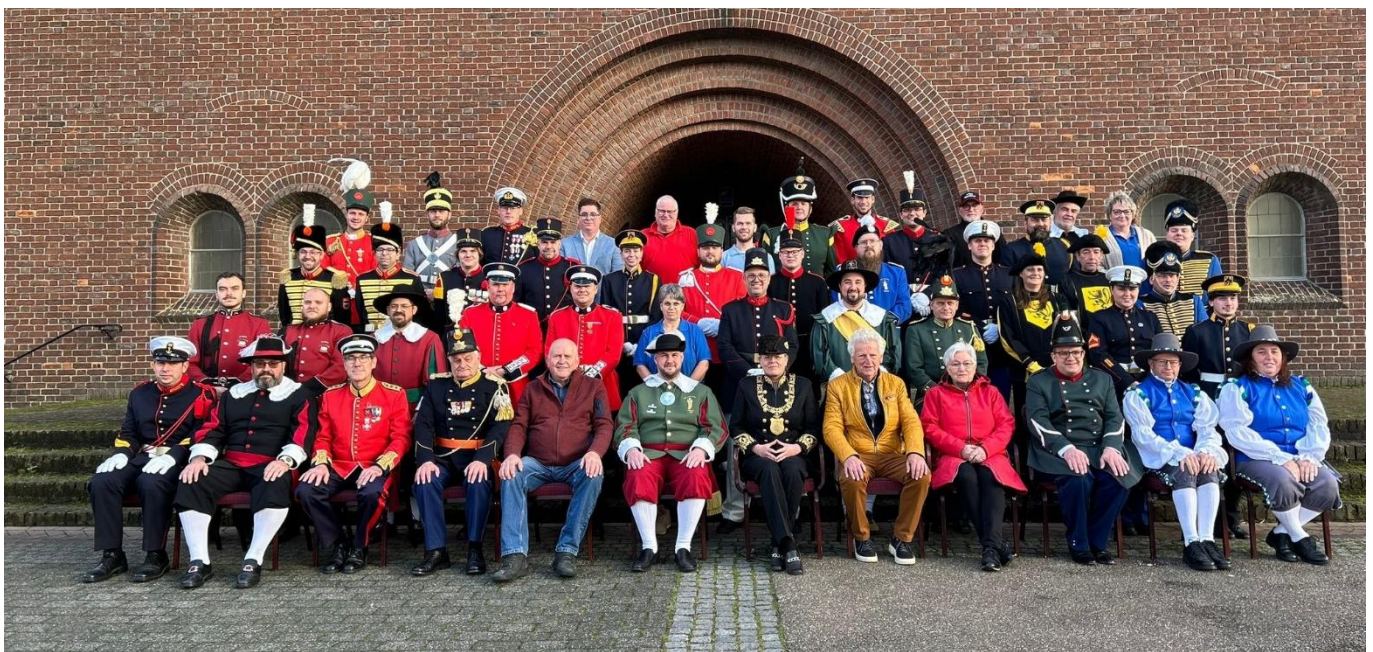
De geslaagden van de buksmeestercursus

De Oud-Limburgse Schuttersfederatie ontvangt een structurele subsidie van de: