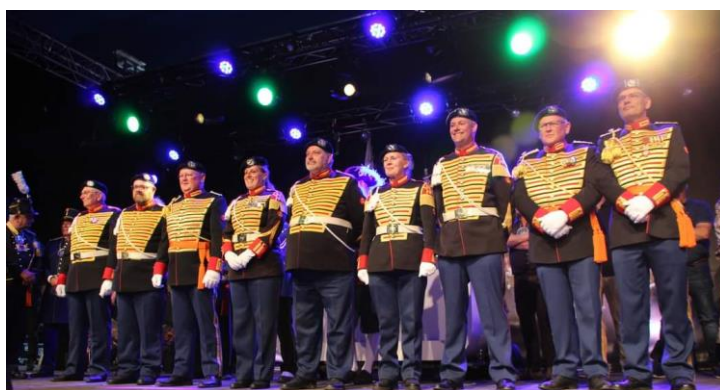
De derde plaats was voor de schutterij Sint Joris Wessem