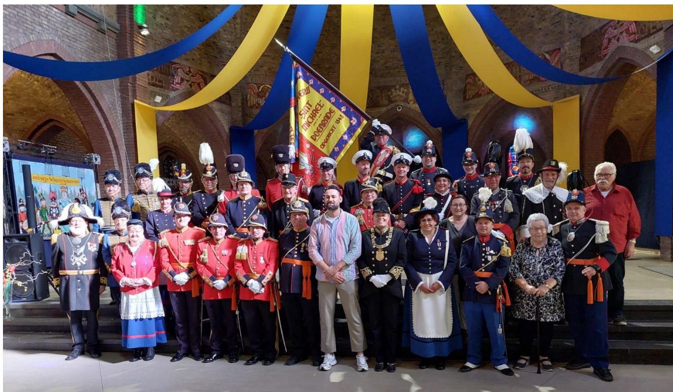
De afvaardiging van: de 9 schutterijen, federatiebestuur en vrijwilligers van het Limburgs Schutterijmuseum

Zondag 14 april 2024 vond in het Limburgs Schutterijmuseum de presentatie plaats van het OLS-Hoekje. Dit jaar extra bijzonder, omdat dit een combinatie is van: de winnaar van het Oud-Limburgs Schuttersfeest, Schutterij Sint Antonius Nederweert en de 9 organisatoren van het Oud-Limburgs Schuttersfeest.