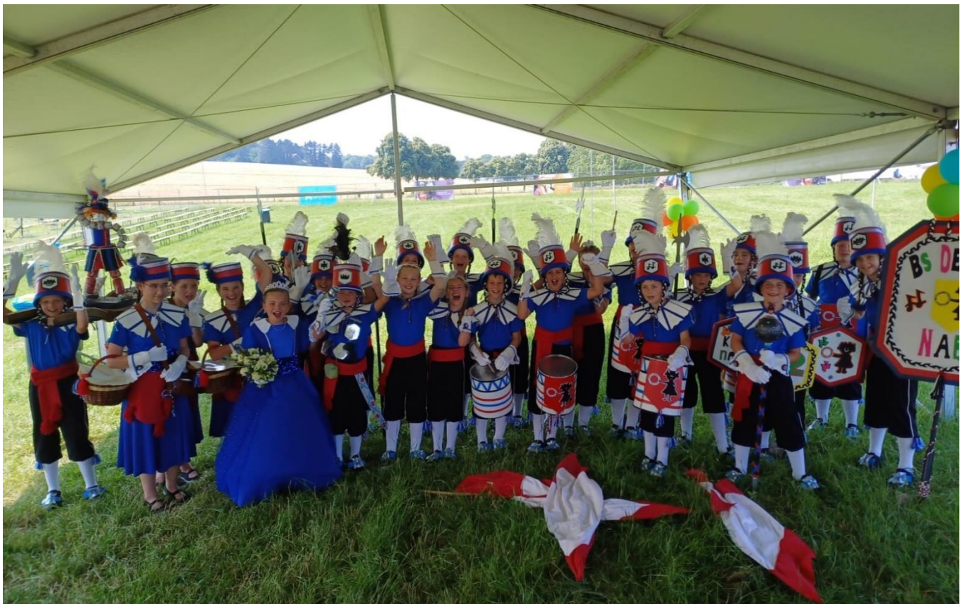
Basisschool de Kwir uit Neer wint het Ummeke