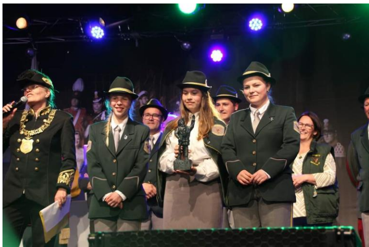
Sint Hubertus Manestraat wint 't Sjötje